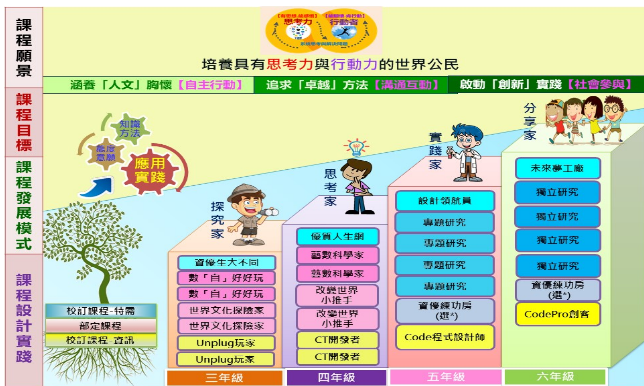
圖2：附小資優班課程地圖