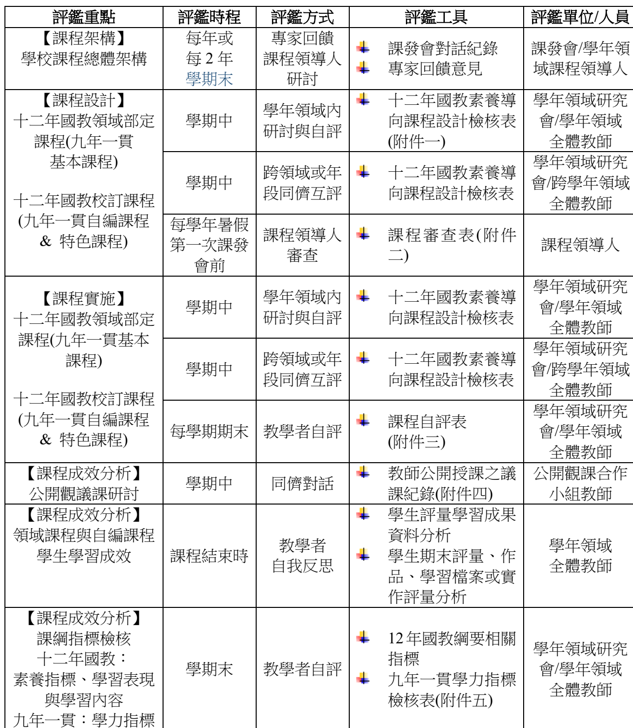
表一 北市大附小課程評鑑內涵一覽表