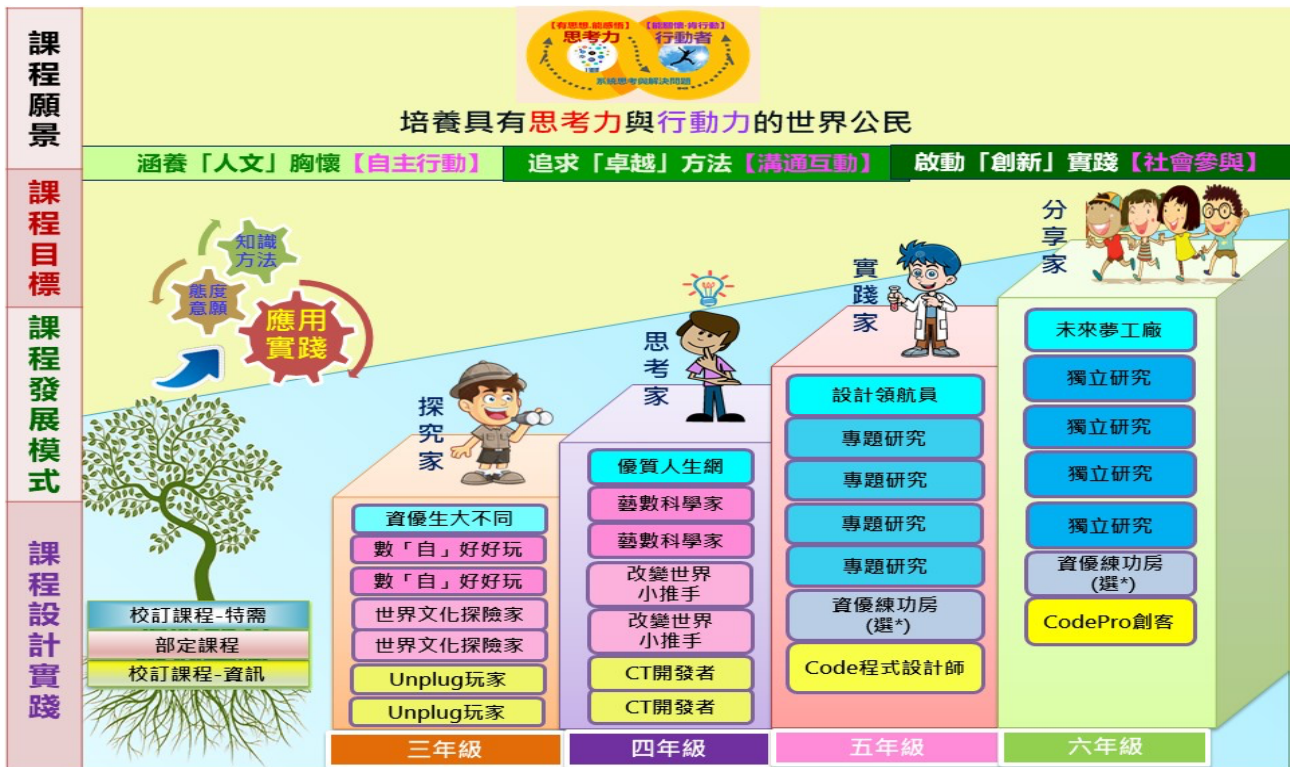
圖2：附小資優班課程地圖