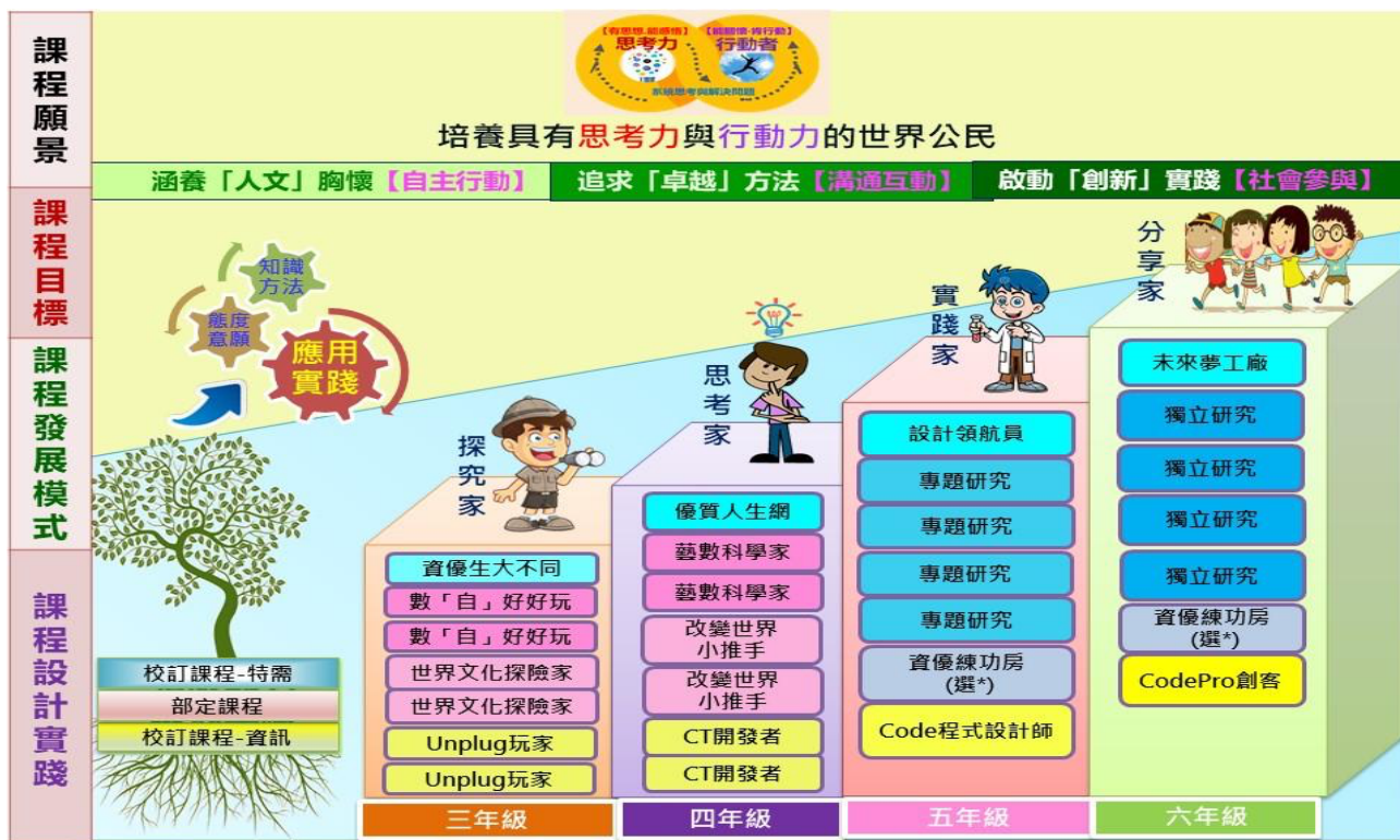
圖 2：附小資優班課程地圖