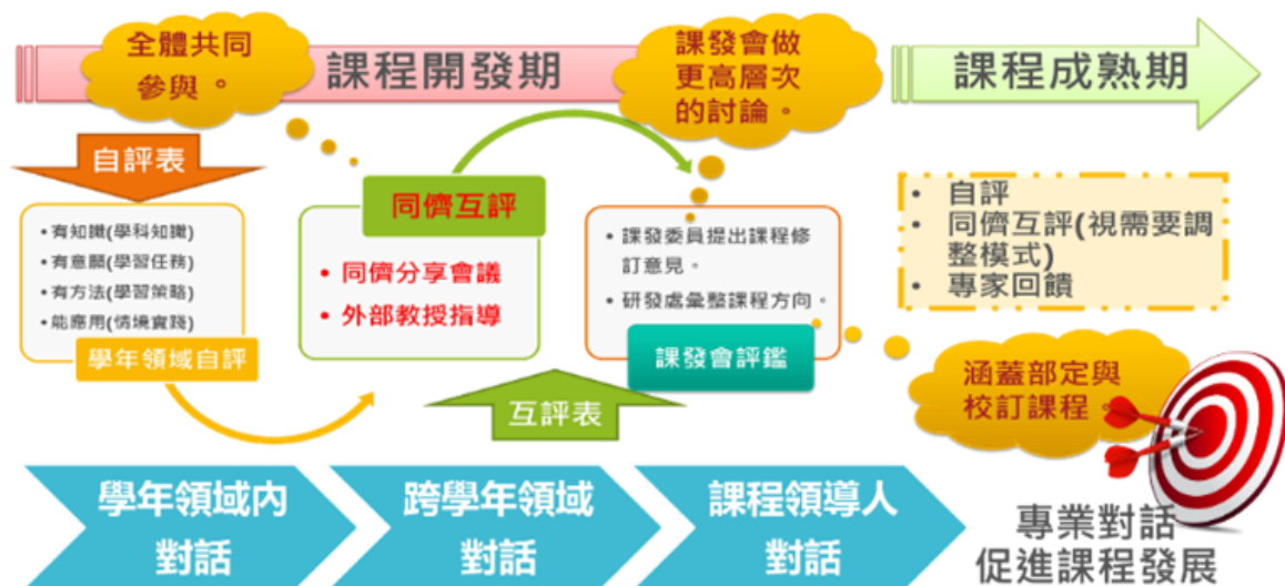
圖 7-7-1 北市大附小課程評鑑模式圖

藉由多元的課程評鑑會議，增進課程設計者與教學者對課程發展與實踐結果的理解，透過專業對話，促進彼此分享，相互欣賞，形成課程發展動力的正向循環。