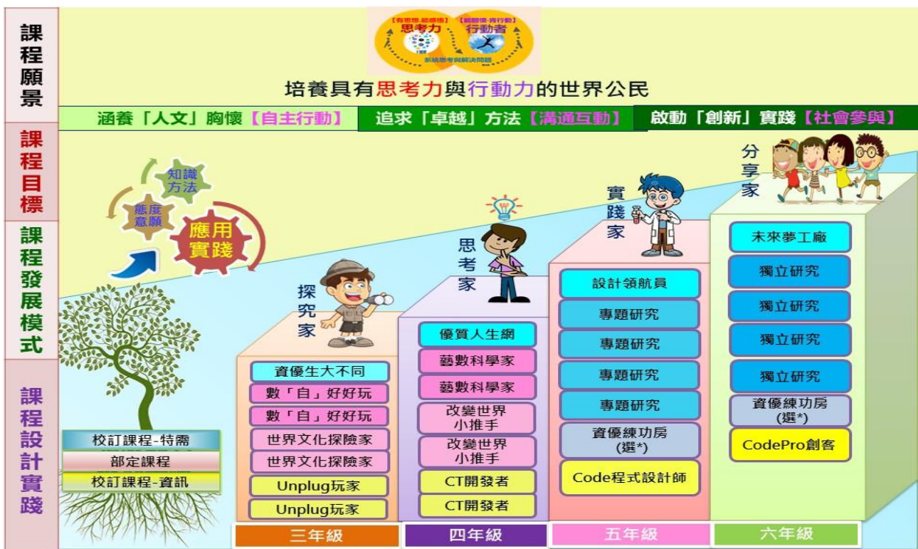
圖 2：附小資優班課程地圖